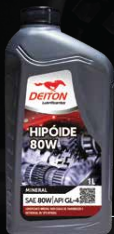
DEITON HIPÓIDE SAE 80W Lubrificante mineral API GL-4

A Linha Deiton Hipóide é composta por óleos lubrificantes desenvolvidos especialmente para lubrificação de caixas de transmissão e diferenciais do tipo hipoidal